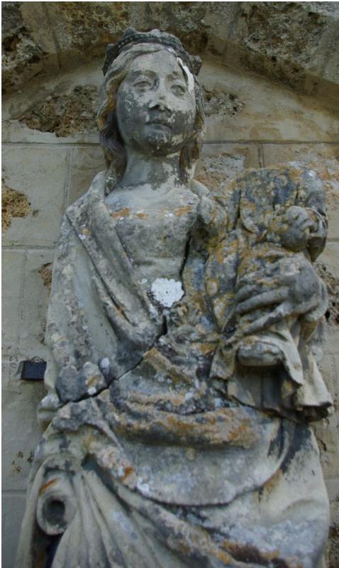
La vierge à l'enfant avant restauration