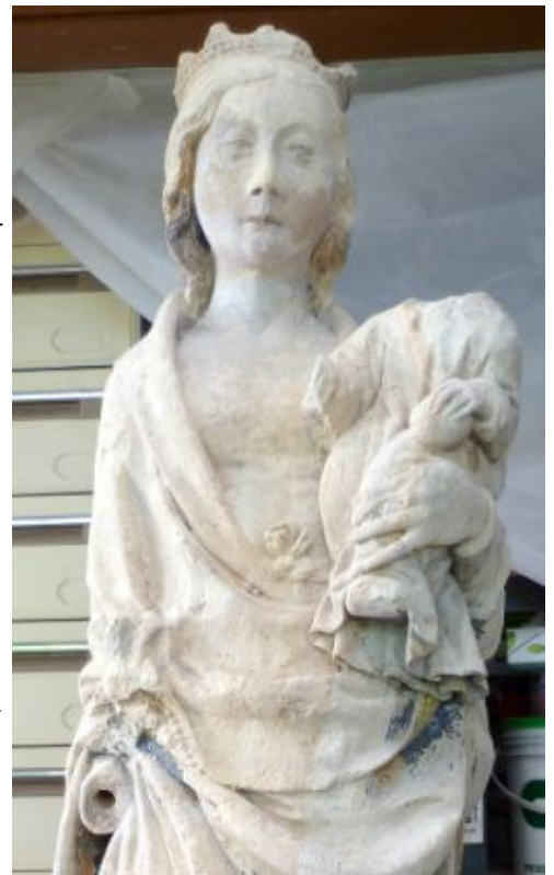
La vierge à l'enfant après restauration